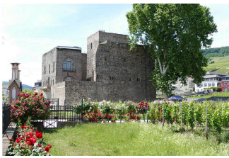
Instandsetzung Rheingauzimmer in der Brömserburg