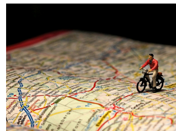
Touristisches Radwegkonzept Rheingau