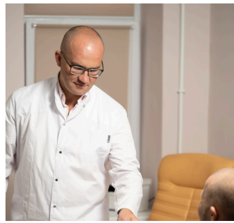
Medizinisches Versorgungszentrum (MVZ) Rheingau