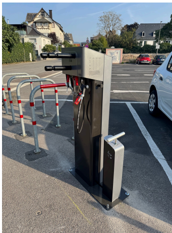
Beschaffung von 7 Fahrradreparaturstation en für den gesamten Rheingau