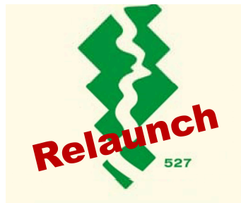
Relaunch des Corporate Designs für das Welterbe Oberes Mittelrheintal