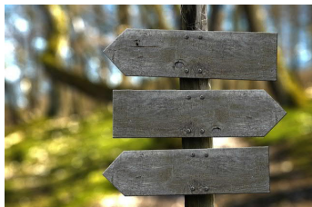
Konzept Naherholungs- potenzial in Walluf