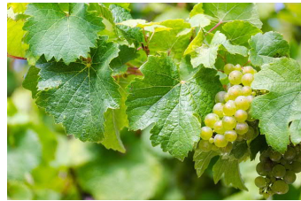
Schnittstellenko- ordination für das KliANet (Personalstelle)