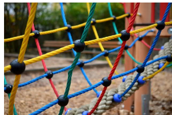
Naturspielplatz am Weinprobierstand in Kiedrich