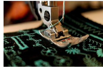
Ausstattung der Nähwerkstatt Eltville